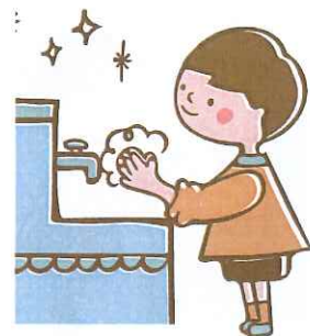
以前、浜田保健所の方に手洗い指導をしていただいた「キラキラ星」の手洗いの仕方です。親子で歌ってみてくださいね。