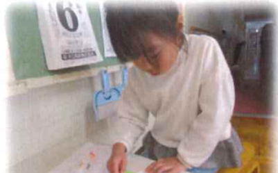
ばら組さんは自分の誕生日に 大好きなお母さんへペンダントを作ります

あおい保育園では、子どもたちは自分の誕生日にお母さんにペンダントを渡します。このペンダントには「自分を生んでくれてありがとう」の気持ちが込められています。