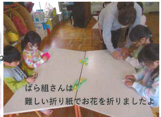
ばら組さんは 難しい折り紙でお花を折りましたよ