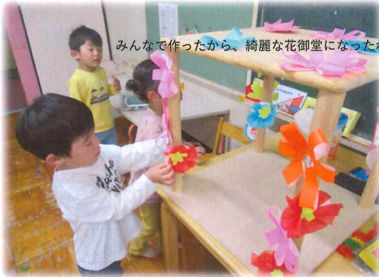
みんなで作ったから、綺麗な花御堂になったね