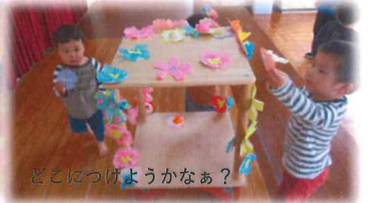
どこにつけようかなあ？